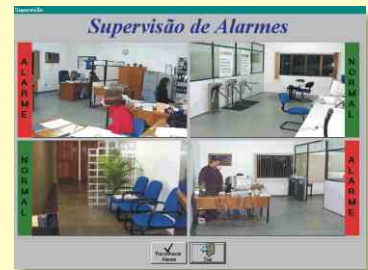
Tela de Controle de Alarme

O terminal TR-100 é também uma Central de Alarmes que pode controlar sensores, de diversos tipos (presença, incêndio, fumaça, vibração, etc), acionando uma sirene, quando em situação de alarme, mesmo sem estar conectado a um microcomputador. A solução Passo 2000 apresenta também um programa, para microcomputador que monitora os sensores, com recursos de apresentação de gráficos, desenhos, ou fotos para identificação dos locais de ocorrência de situações de alarme.