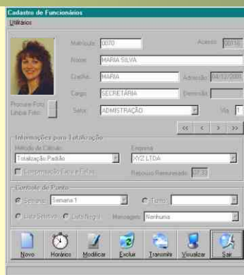
Tela de Cadastro de Funcionários

Programa completo para gerenciamento e automação de ponto de funcionários. Os principais recursos são: Cadastro de Funcionários com foto, Controle de até 250 horários/jornadas, Listas diversas para validação de ponto, Acionamento de Sirenes, Cálculo de totalização de horas (Normais, Extras, Adicional Noturno, etc) e Exportação de dados para Folha de Pagamento.