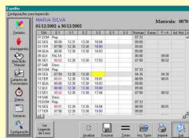
Tela de Espelhos