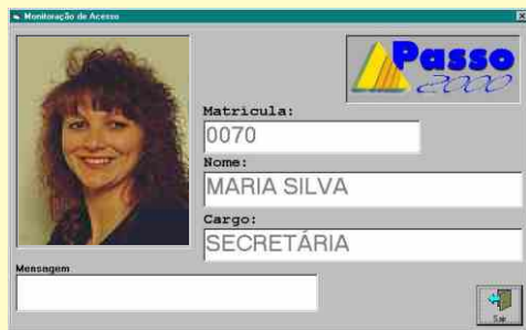
Tela de Controle de Acesso

Programa para controlar o acesso de funcionários e visitantes, através da apresentação de fotos em vídeo e registros de entrada e saída, permitindo a fiscalização e o controle total do acesso a empresa.